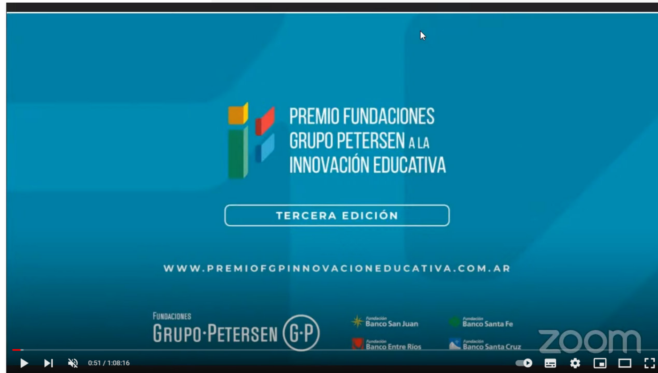
Webinar Lanzamiento Edición 2022 (Video)